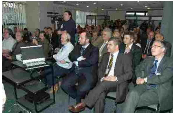
Secvență din timpul desfășurării atelierelor de lucru