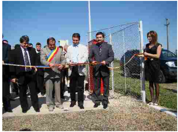
Luna aprilie 2010 vizita în orașul Pâncota – finalizare și inaugurare a 4 obiective de investiții din oraș