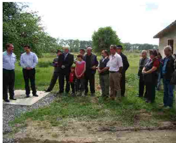
Vizita comuna Beliu luna mai 2010: inaugurarea rețea de alimentare cu apă și teren de fotbal în localitate;