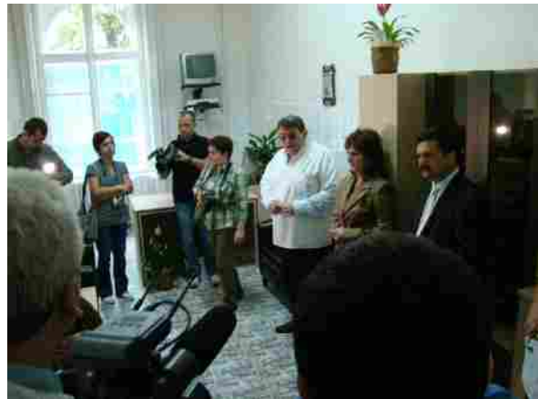
Vizită și inaugurare rezerve Spitalul Matern- luna mai 2010