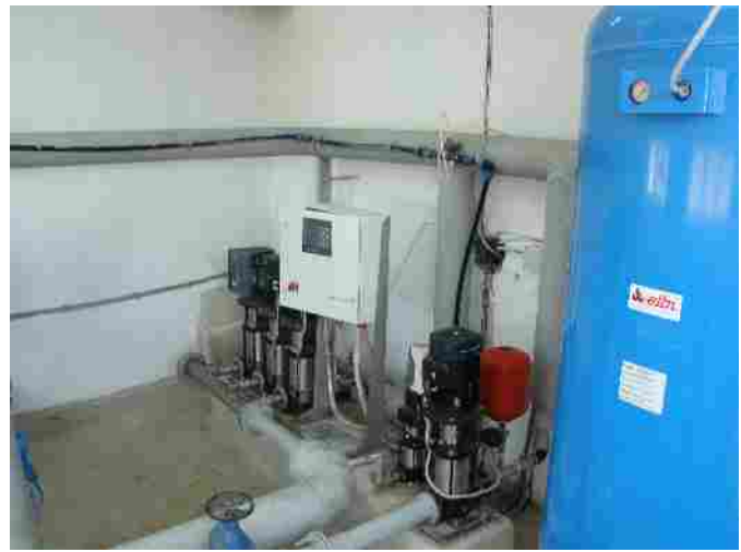
Inaugurare rețea de alimentare cu apă în satele Mailat și mănăștur, com. Vinga luna iulie 2010