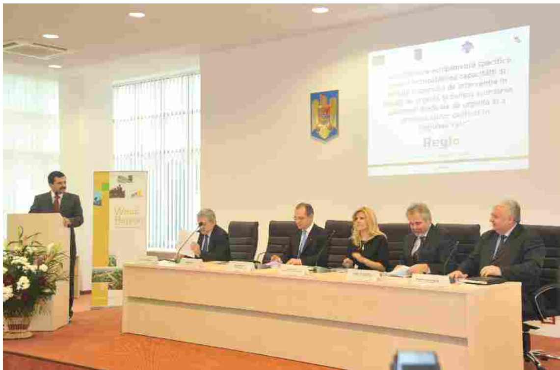
Ședința ADR Vest prezidată de prim ministrul al României dl. EMIL Boc, cu participarea dnei ministru Elena UDREA luna martie 2010