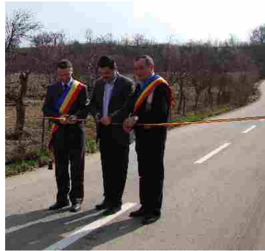
Inaugurare DJ 793 Hasmas-Archis luna martie 2010