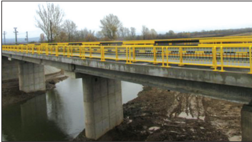
Noul pod asigură un trafic în condiții optime de siguranță a traficului și confort

Vechiul pod este uzat fizic și nu mai prezintă siguranță pentru traficul rutier, mai ales pentru cel de tonaj greu. Astfel, construind noul pod, administrația județeană a evitat ca prin închiderea celui vechi să ducă la o semiizolare a zonei de nord a județului.