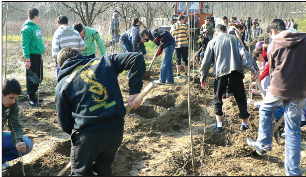
Consiliul Județean Arad acționează pentru „Un Arad verde...”