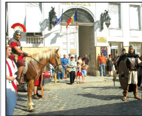
În cetatea Lipovei, muzeul este la loc de cinste

Muzeul este adăpostit de casa care a aparținut omului politic Sever Bocu, în perioada 1922 - 1953. Cele cinci săli ale expoziției permanente păstrează încă amenajările interioare fastuoase comandate de Bocu: parchetul cu intarsii, sobele din faianță vieneză, policandrele și oglinzile din cristal, piese de mobilier.