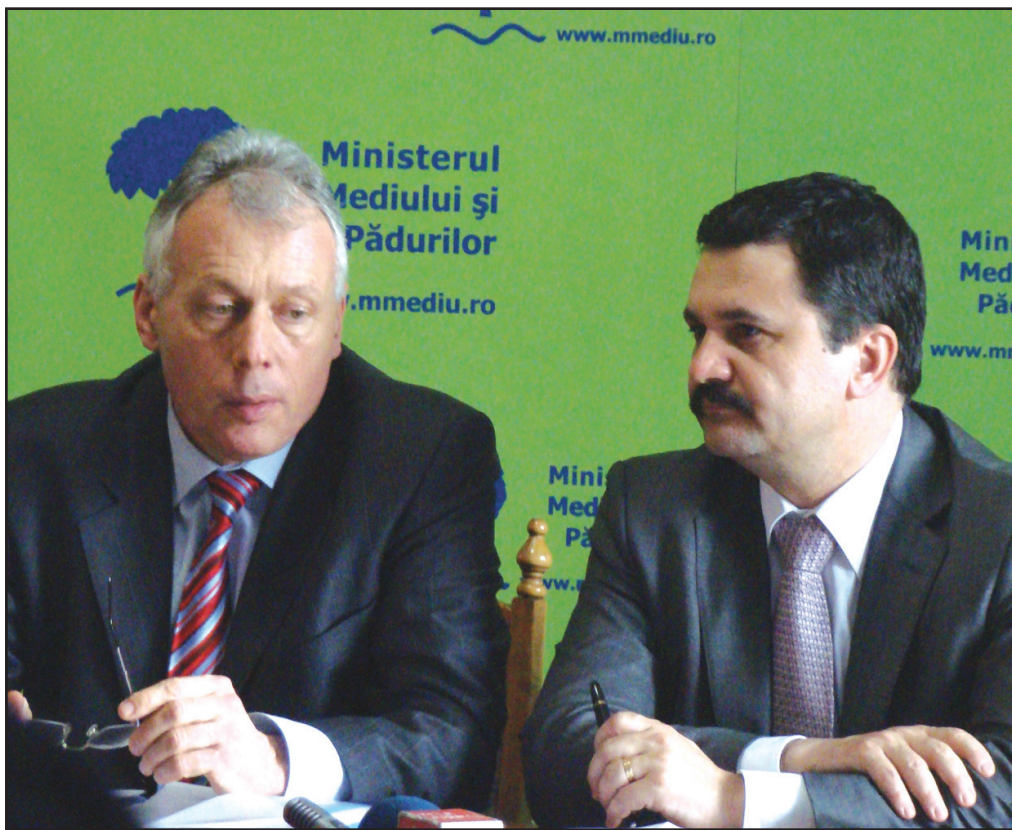
Lázlo Borbély, Ministrul Medilui alături de Nicolae Ioțcu, președintele CJA

TVA, Proiectul va fi implementat pe parcursul a 40 de luni, în perioada 2010-2013. Din suma totală, 21.838.638 Euro reprezintă finanțare nerambursabilă din Fondul European de Dezvoltare Regională și 4.913.695 Euro finanțare nerambursabilă de la bugetul de stat. Contribuția financiară de la bugetele locale este de 2.883.462 Euro.