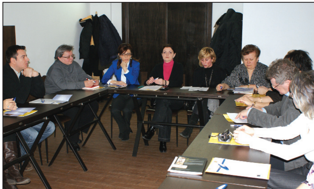
Specialiștii din domeniu s-au reunit pentru a analiza oportunitățile de angajare ale persoanelor cu handicap

În cea de-a doua parte a zilei, s-a desfășurat o întâlnire de lucru cu specialiștii care deja au implementat și utilizat instrumentele dezvoltate în cadrul proiectului. Experții internaționali au colectat feedback-ul necesar