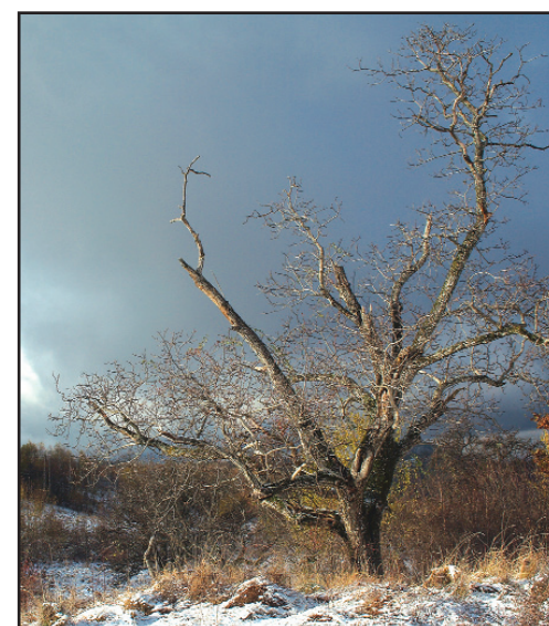
Ovidiu Filip, „Amenințarea - singur în afișarea sfârșitului (Văsoaia)”