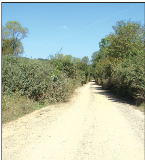
Legătură directă între Valea Mureșului și Valea Crișului

Lucrările de modernizare a tronsonului de drum dintre Julița și Mădrigești, unul dintre cele mai importante proiecte demarate la nivelul județului Arad în toamna anului 2009, au intrat în execuție la mijlocul lunii martie. Proiectul este finanțat din fondurile Uniunii Europene, în cadrul Programului Operațional Regional 2007–2013, Axa prioritară 2. Con-