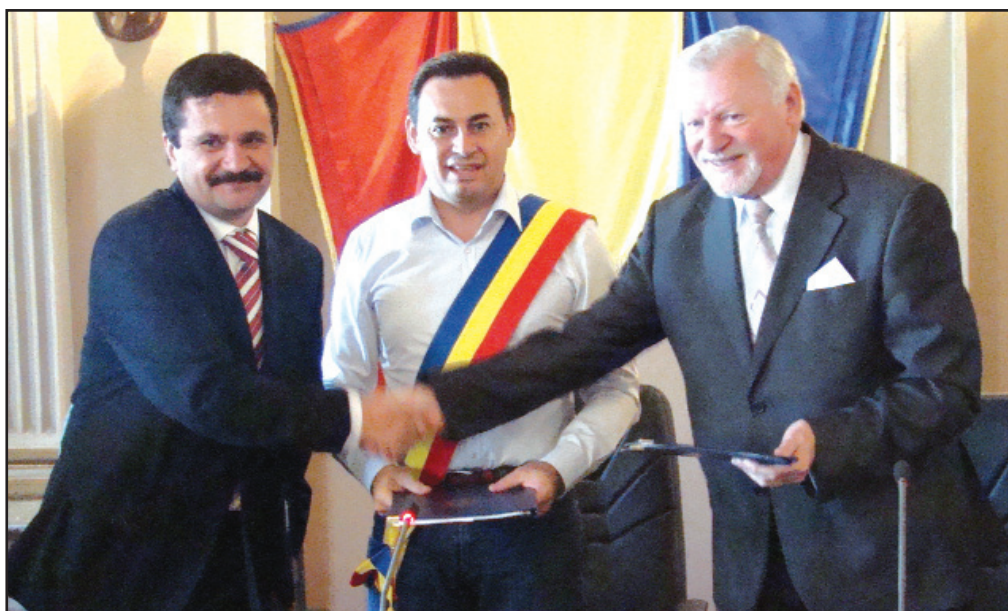
Consiliul Județean, Primăria și Universitatea „Vasile Goldiș” - un proiect reușit

De asemenea, administrația județeană a alocat fonduri și pentru premierea unor performanțe sportive, în prim-plan figurând tot fotbalul. „Avem o echipă campioană națională, de la Atletico, avem o vicecampioană națională, la fotbalul școlar, de la Școala din Apatcu, și am decis să premiem performan-