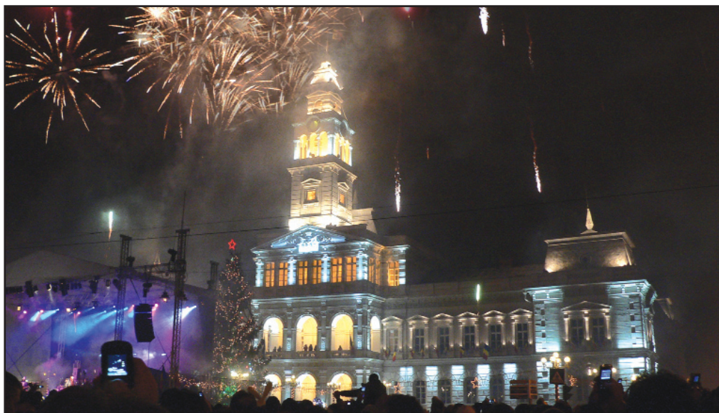
Gheorghe Budiu, „Noaptea de Revelion la Primărie”

Fotografii amatori sau profesioniști care doresc să participe la concurs trebuie să depună fotografiile pe CD sau DVD la Centrul Cultural Județean Arad până la data de 12 aprilie.