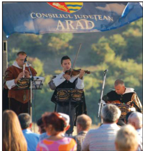
Festival: Sărbătoare la Bizere Frumușeni

Muzeul se află în contact cu peste 120 de instituții similare din țară și din străinătate precum și cu numeroase instituții academice. Cu acestea se derulează programe și proiecte comune, se desfășoară schimburi de experiență prin participarea specialiștilor la manifestări științifice și stagii de documentare. De asemenea, sunt derulate constant schimburi de publicații de specialitate.