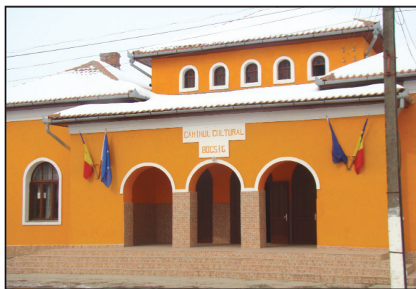
Căminul Cultural, realizare proprie a comunei

De asemenea, edilii din Bocsig au depus o cerere de finanțare pentru consolidare, reabilitare, modernizare și extindere școli în întreaga comună. Proiectul este depus pe POR, axa 3.4. Valoarea totală a investiției se ridică la 8.723.000 lei din care contribuția beneficiarului este de 175.000 lei și finanțare nerambursabilă 8.548.000 lei. Proiectul se află în stadiu de întocmire a cererii de finanțare.