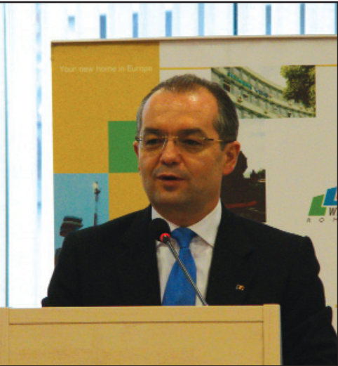
Primul ministru, Emil Boc

„În contextul actual al crizei economice, România are șansa utilizării fondurilor europene, pentru a depăși cât mai repede recesiunea”, a declarat primul-ministru, care a îndemnat administrațiile locale să accelereze organizarea licitațiilor pentru proiectele de investiții cu finanțare europeană deja aprobate și semnate, pentru ca acestea să poată ajunge cât mai repede în faza de implementare.