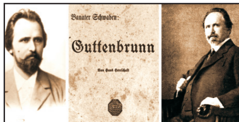
Muzeul cuprinde volume, manuscrise, documente