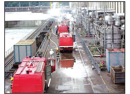
Regiunea Vest va beneficia de 14 astfel de utilitare

tru, proiecte pe care le derulăm împreună. O să ne străduim să alocăm fonduri. O să ne străduim să găsim resurse în acest an pentru a iniția proiecte noi pe programele pe care le avem”, a afirmat Elena Udrea, Ministrul Dezvoltării Regionale și Turismului.