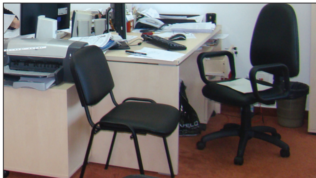
Consilierii județeni, reuniți la vot

se va realiza prin concurs sau examen, pe baza criteriilor de selecție stabilite prin regulament de către ordonatorul principal de credite în raport cu cerințele postului.