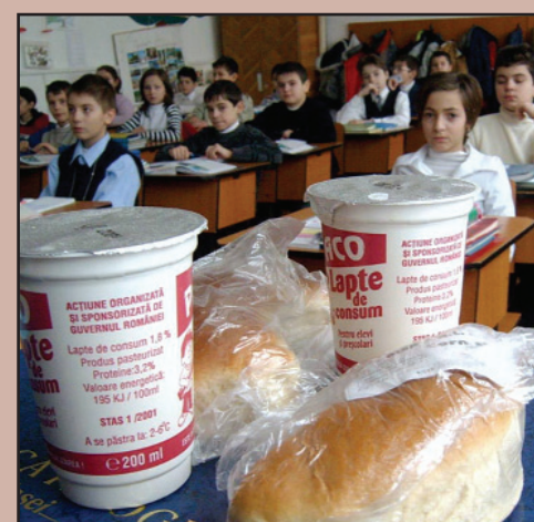
Consiliul Județean va furniza produse lactate și de panificație aferente anului școlar 2010-2011

- Furnizare produse lactate an școlar 2010-2011; - Furnizare produse de panificație an școlar 2010-2011.