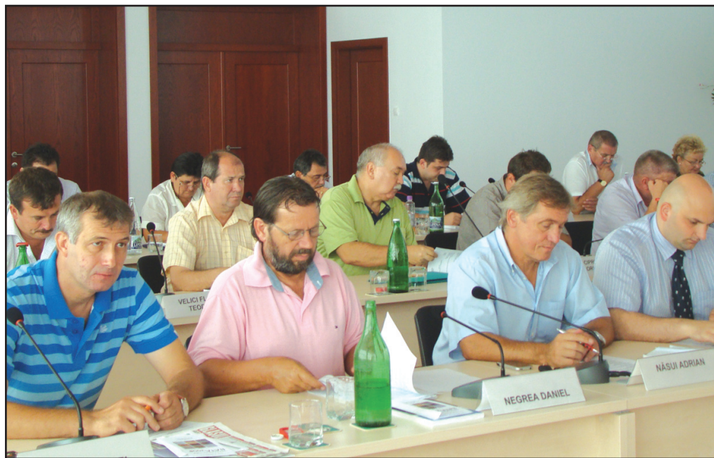
Consilierii județeni, reuniți la vot