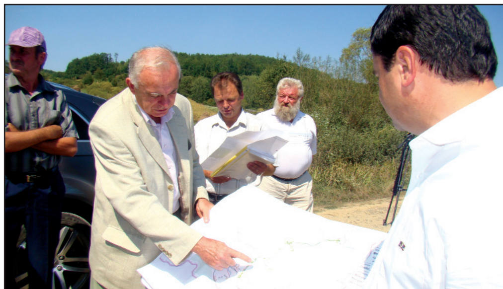
Constructorul prezintă detalii tehnice președintelui Consiliului Județean

„Este unul dintre cele mai importante proiecte demarate la nivelul județului Arad. Prin modernizarea drumului Julița - Mădrigești se dorește crearea unei legături directe între Valea Mureșului și Valea Crișului. Astfel, se scurtează drumul dintre Săvârșin și