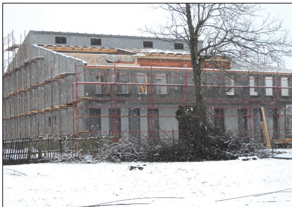
Stadiul actual al Gărzii de Intervenție

În prima fază, la Birchiș va funcționa, în fapt, un punct de lucru, urmând ca în urma demersurilor legale care se demarează în astfel de situații, să devină gardă de intervenție, în subordinea Subunității de Pompieri Bârzava. Cel mai probabil, punctul de lucru va deveni funcțional în primul semestru al acestui an, ocazie cu care doresc să mulțumesc conducerii Consiliului Județean pentru sprijinul și înțelegerea de care a dat dovadă în realizarea acestui obiectiv».