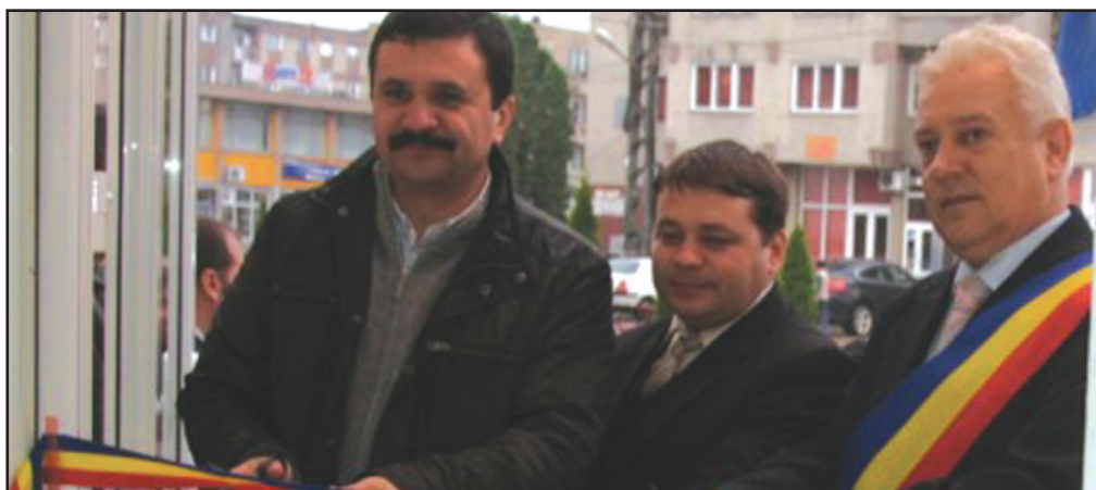
Momentul inaugurării sediului Administrației Fiscale Sebiș