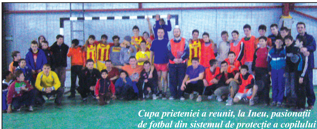
Cupa prieteniei a reunit, la Ineu, pasionații de fotbal din sistemul de protecție a copilului

Instituții și organizații nonguvernamentale locale care vor beneficia de modelul de bună practică elaborat la sfârșitul proiectului: Comunitatea locală.