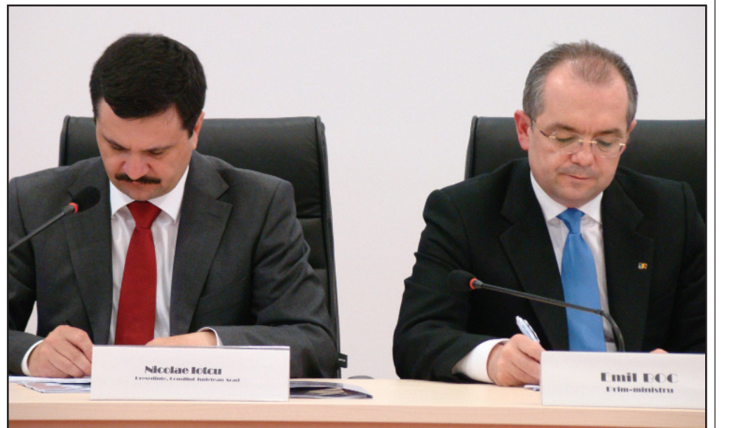
Nicolae Ioțcu și Emil Boc își pun semnătura pe un proiect de 11 milioane de euro

Valoarea totală a proiectului este de 12.050.840 euro, finanțarea nerambursabilă ridicându-se la 9.737.770 euro. Durata implementării este de 18 luni, proiectul primind finanțare în baza axei prioritare numărul 3, „Îmbunătățirea infrastructurii sociale”. Elementele din proiect nu prezintă neapărat o noutate pentru arădeni, el fiind deja cunoscut. Se vor achiziționa 14 autospeciale pentru lucrul cu apă și spumă, două de intervenție la accidente colective și salvări urbane, patru de cercețare NBCR, patru pentru descarcerări grele, 11 autospeciale complexe de intervenție, descarcerare și acordarea asistenței medicale de urgență, patru ambulanțe de prim ajutor și cinci de reanimare.