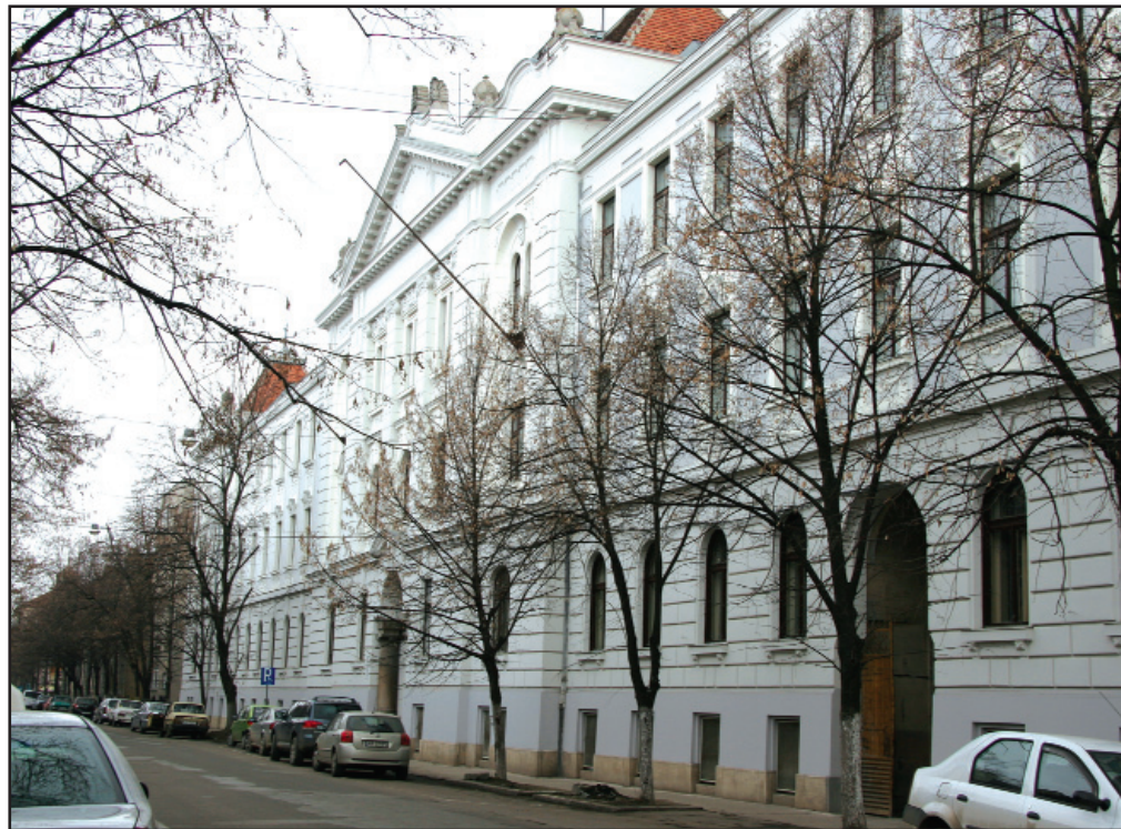
Biblioteca Județeană Arad