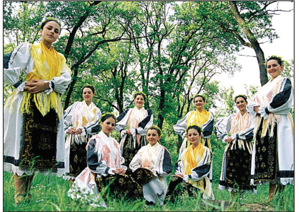
Zilele Școlii Populare de Arte Arad

Festivalul interjudețean „Pop Star” își va desfășura la 5 mai, pe scena sălii Palatului Copiilor din Arad, cea de a XVIII-a ediție. Reprezentând un concurs de interpretare a muzicii pop, deschis elevilor de la școlile și liceele de artă din țară, manifestarea a fost gândită ca un prilej de evidențiere a talentelor, dar și un mijloc de cultivare a preocupărilor pentru repertoriul național și internațional de valoare. În cadrul festivalului, organizat cu sprijinul Centrului Cultural Județean Arad, școala va înscris, din rândul elevilor săi, în urma unor selecții, un număr de zece participanți.