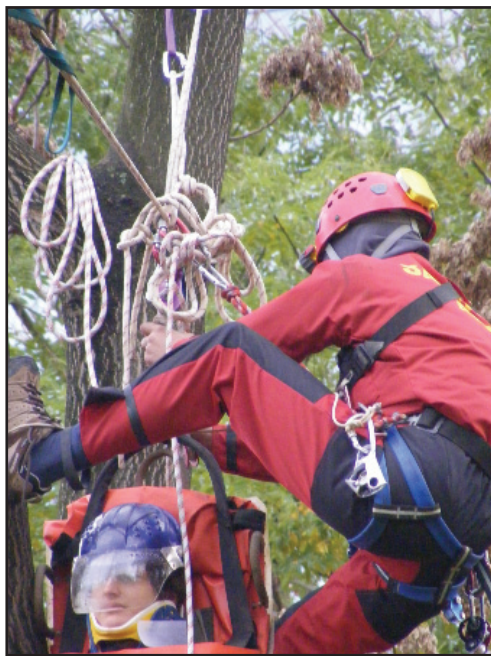
Uneori, viața unui om depinde de abilitățile salvatorului

Din datele puse la dispoziție de către Corpul Roman Salvaspeo, ( CORSA ), în județul Arad