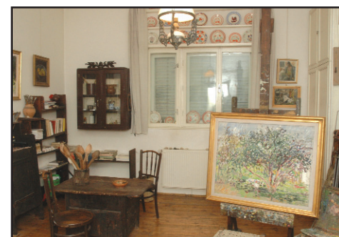
Picturile de la Săvârșin încântă ochiul vizitatorului

Lucrările de artă, în cea mai mare parte pictură, expuse în salon, atelier și în hol, sunt realizate de Eugen Popa în intervalul 1940 - 1980. Portretul soției, cele ale părinților, casa veche părintească, o serie de autoportrete cu pălărie stil Rembrandt vin să însuflețească și să re/compună o atmosferă familială. Podul casei, complet și modern renovat, este o mansardă nedelimitată prin pereți, unde predomină lucrările pictorului, majoritatea din anii '80 până în 1995. Alături de naturi moarte, peisaje din Săvârșin sau de la Otopeni, cicluri de desene ( Portretul, Nudul, Zbor, Structuri vegetale ), aici pot fi văzute lucrări semnate de Jean Al. Ste-