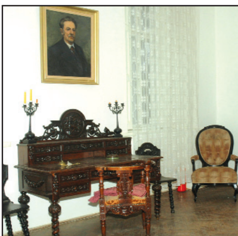
Ioan Slavici, părintele spiritual al Șiriei

Program de vizitare: Ma-D 9.00-17.00; L- închis