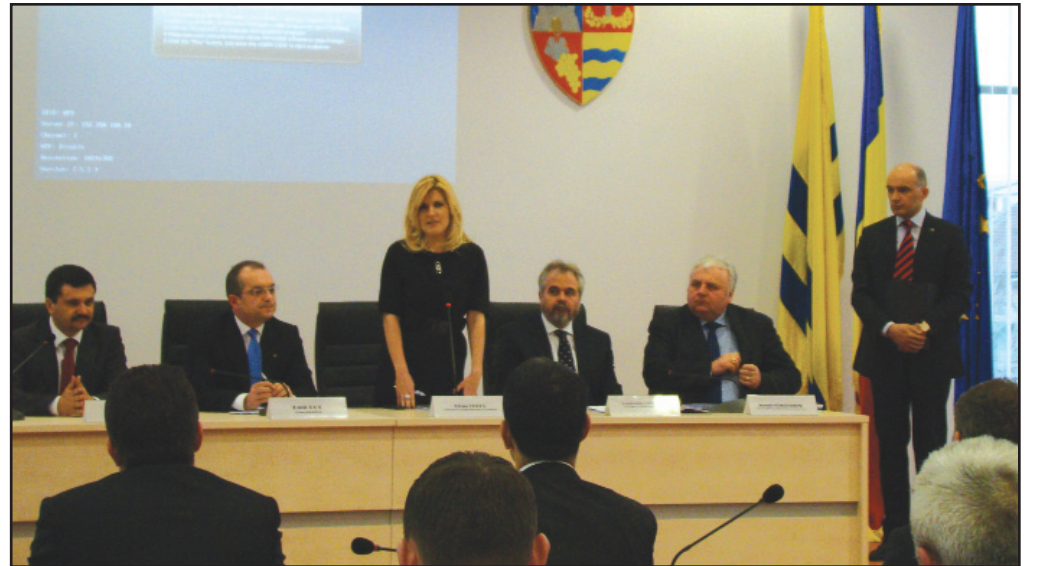
Elena Udrea, ministrul Dezvoltării Regionale și Turismului, conduce un minister în care comunitățile locale își pun mari speranțe

Obiectivul general al proiectului este acela de a crea premisele necesare creșterii calității serviciilor pentru siguranța publică și de asistență medicală în situații de urgență și de dezastru majore prin îmbunătățirea infrastructurii, urmărinduse astfel sprijinirea unei dezvoltări economice și sociale durabile și echilibrate teritorial, la nivelul Regiunii