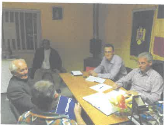
AUDIENȚE LA USUSĂU 28.10.2016 ORA 16,30