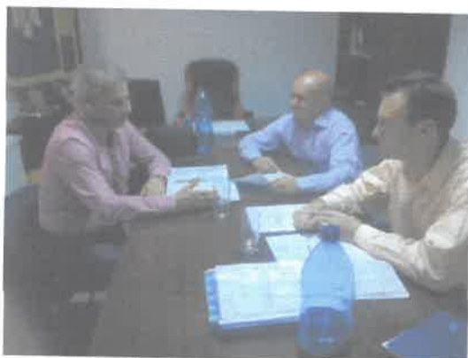
AUDIENȚE LA BIRCHIȘ 28.10.2016 ORA 18,30