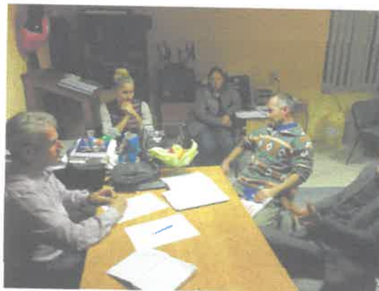
AUDIENȚE LA BATA 28.10.2016 ORA 17,30