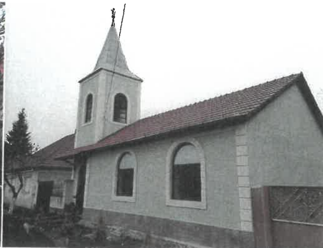
Biserica reformată din Zimand Cuz înainte și după renovare – sprijin financiar 10.000 lei de la Consiliul Județean Arad.