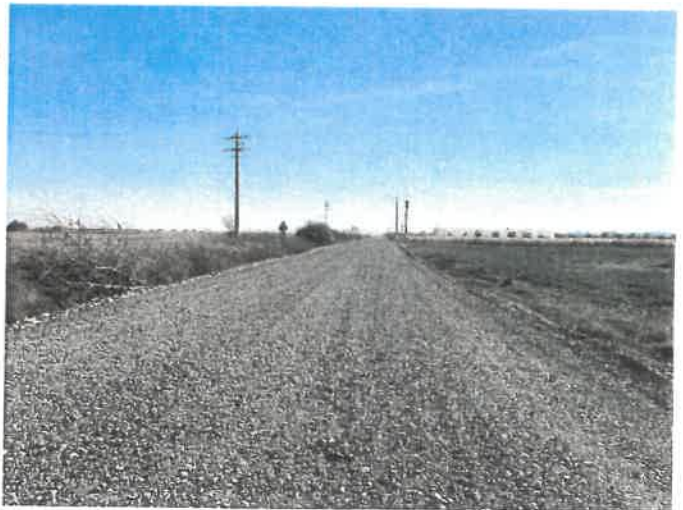
Am fost prezent pe teren, când firma PORR a început lucrările de modernizare a drumului județean Șofronea – Zimand Cuz - 5,7 km.