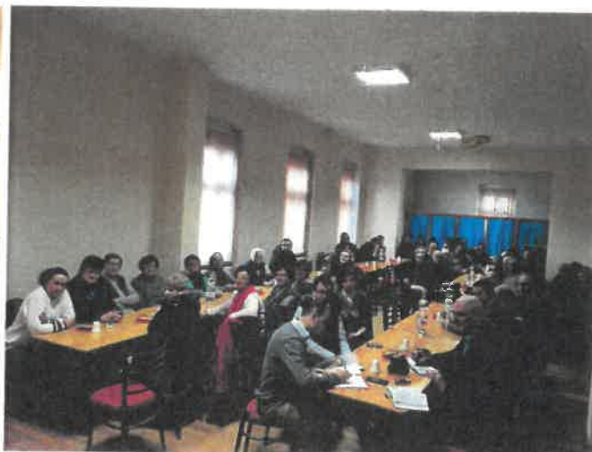
Întâlnire cu cetățenii din localitățile Mailat și Dorobanți.

La fel ca în anul 2018, Programul de audiențe la sediul UDMR Organizația Județeană Arad este următorul: luni, marți, miercuri, joi între orele 16:00-17:00 în Arad, str. Episcopiei nr. 32, județul Arad.