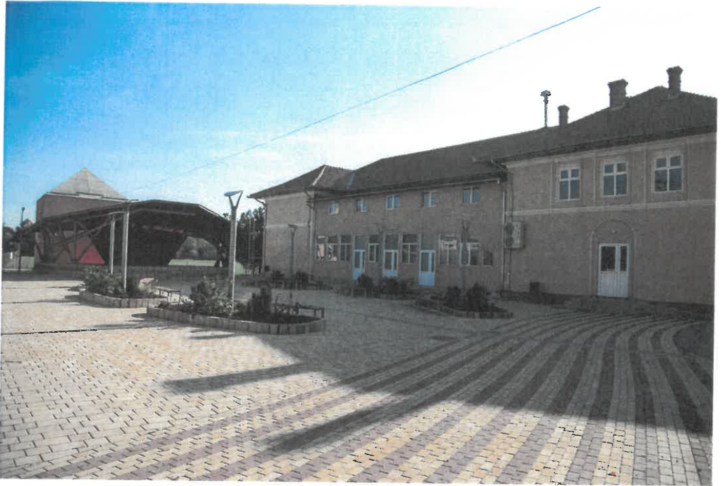
O realizare de excepție în anul 2019 este Centrul civic din Comuna Dorobanți, realizat cu sprijin financiar de la Consiliul Județean Arad.