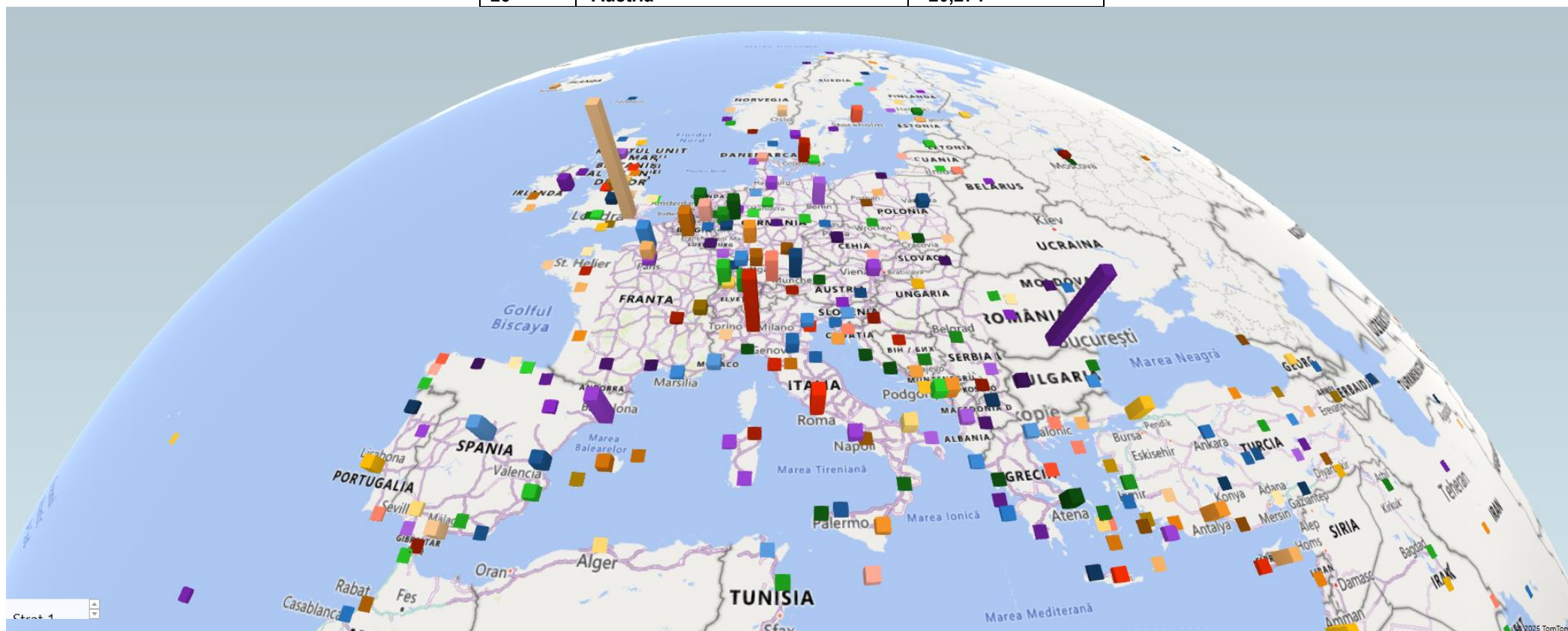
Harta 3D a Europei și Asia Mică TOP Aeroporturi de destinație preferate de populația rezidentă la o rază de 150 km față de Arad, Informa ASM Catchment Analyser pentru anul 2024